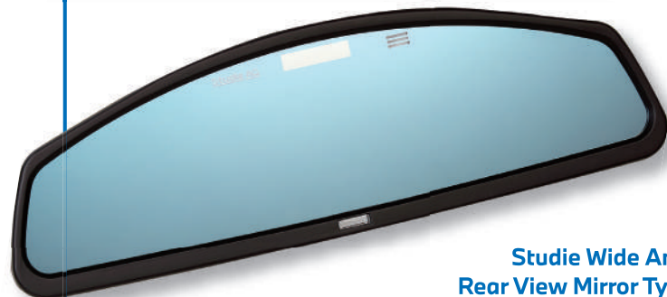
Studie Wide Angle Rear View Mirror Type2

税抜 10,000 円 | 税込 11,000 円 適合: 後期 ETC ミラー