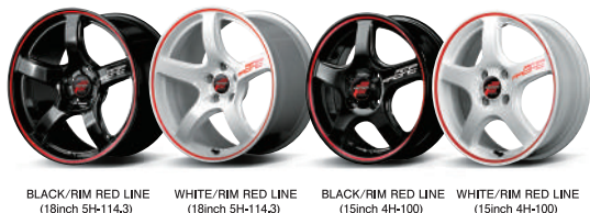
BLACK/RIM RED LINE (18inch 5H-114.3) WHITE/RIM RED LINE (18inch 5H-114.3) BLACK/RIM RED LINE (15inch 4H-100) WHITE/RIM RED LINE (15inch 4H-100)