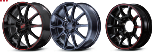
BLACK/RIM RED LINE (18inch 5H-114.3) DEEP TITAN SILVER (18inch 5H-114.3) BLACK/RIM RED LINE (16inch 5H 139.7 MODEL)