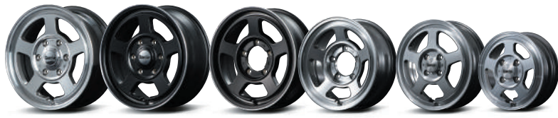
METALLIC GRAY POLISH (16inch 6H-139.7) SEMI GLOSS BLACK / VALLEY + FLANGE POLISH (16inch 6H-139.7) SEMI GLOSS BLACK / VALLEY + FLANGE POLISH (16inch 5H-139.7) METALLIC GRAY POLISH (15inch 5H-139.7) METALLIC GRAY POLISH (15inch 4H-100) METALLIC GRAY POLISH (12inch 4H-100)