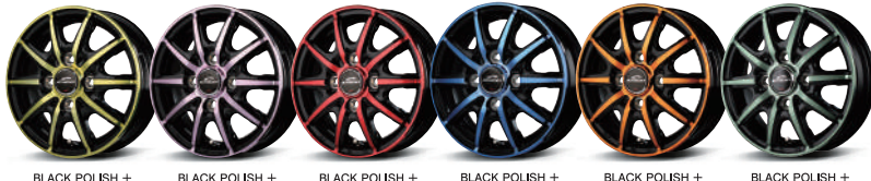
BLACK POLISH + CRYSTAL GOLD CLEAR BLACK POLISH + CRYSTAL PINK CLEAR BLACK POLISH + CRYSTAL RED CLEAR BLACK POLISH + CRYSTAL BLUE CLEAR BLACK POLISH + CRYSTAL ORANGE CLEAR BLACK POLISH + MILKEY GREEN CLEAR