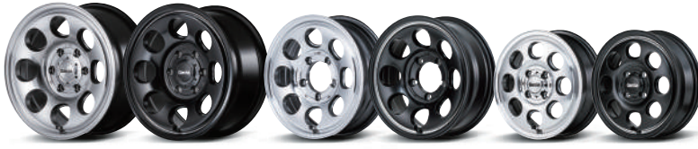
METALLIC GRAY POLISH (17inch 6H-139.7) SEMI GLOSS BLACK / VALLEY POLISH (17inch 6H-139.7) METALLIC GRAY POLISH (16inch 5H-139.7-5) SEMI GLOSS BLACK / VALLEY POLISH (16inch 5H-139.7 20) METALLIC GRAY POLISH (14inch 4H-100) SEMI GLOSS BLACK / VALLEY POLISH (14inch 4H-100)