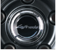
レクサス純正センターキャップ対応