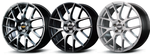
HYPER METAL COAT / MIRROR CUT / SEMI GLOSS GUNMETA / POLISH / 3D BRUSHED