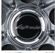
レクサス純正センターキャップ対応