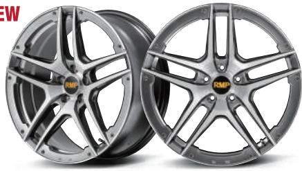
HYPER METAL COAT/BRUSHED/UNDER CUT