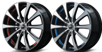
BLACK POLISH / UNDERCUT RED (18inch 5H-114.3) BLACK POLISH / UNDERCUT BLUE (18inch 5H-114.3)