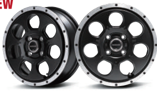
SEMI GLOSS BLACK/FLANGE DC