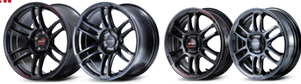
CRYSTAL BLACK (18inch 5H-114.3) DEEP TITAN SILVER (18inch 5H-114.3) CRYSTAL BLACK (15inch 4H-100) DEEP TITAN SILVER (15inch 4H-100)