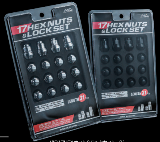
MID 17HEX ナット&ロックセット L31