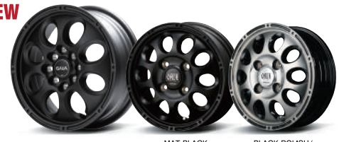
FULL MAT BLACK (14inch 4/4H-100) MAT BLACK (12inch 4H-100) BLACK POLISH/BLACK CLEAR (12inch 4H-100)