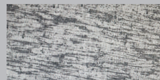
フローフォーミング後の素材断面

この度採用したフローフォーミング FF は鋳造と鍛造のメリットを併せ持つ製法です。フローフォーミング FF ではまずディスク面とリム部分を鋳造。リム部分に圧力をかけながらスピニング加工を施して必要最低限の薄さまで引き延ばします。その結果、アルミ素材の密度が上がり、鍛造ホイールに迫る鍛流線(メタルフロー)を実現。ディスク面は鋳造成型なのでデザインの自由度を確保。高い「強度」「剛性」「軽量」「デザイン性」を兼ね備えたホイールを作ることが可能になりました。