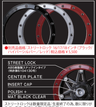
オプション: ストリートロック ブラック

●別売品価格: ストリートロック 16/17/18インチ (ブラック/ハイパーシルバー/レッド) 税込価格 ¥5,500