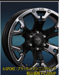
6-SPOKE: ブラック×マシニンググリッド 税込価格 ¥2,200UP