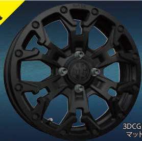
3DCG イメージ マットブラック