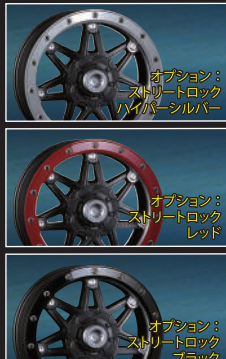
オプション: ストリートロック レッド