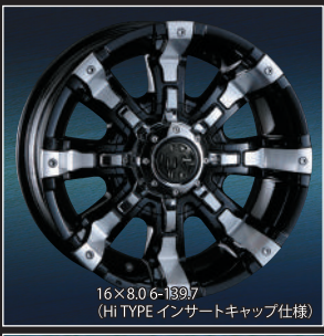
16×8.0 6-1397 (Hi TYPE インサートキャップ仕様)