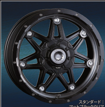
スタンダード: マットブラッククリア