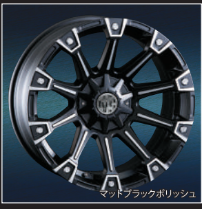
マットブラックポリッシュ