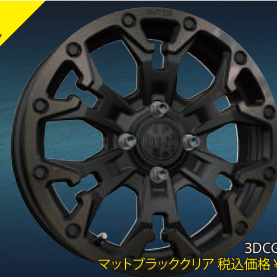
3DCG イメージ マットブラッククリア 税込価格 ¥2,200UP