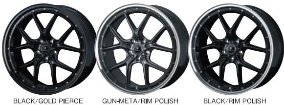
BLACK/GOLD PIERCE GUN-META/RIM POLISH BLACK/RIM POLISH