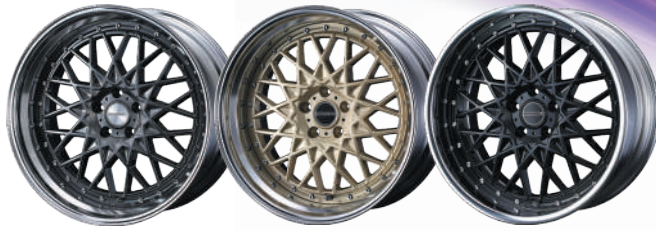
20inch HYPER METAL BLACK 20inch SAMURAI GOLD 20inch GLAZE BLACK