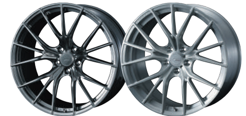
21inch DIAMOND BLACK 20inch BRUSHED