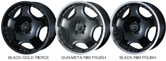
BLACK/GOLD PIERCE GUN-META/RIM POLISH BLACK/RIM POLISH