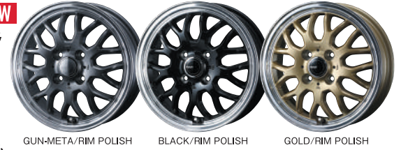
GUN-META/RIM POLISH BLACK/RIM POLISH GOLD/RIM POLISH