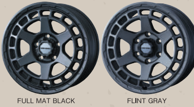
FULL MAT BLACK FLINT GRAY