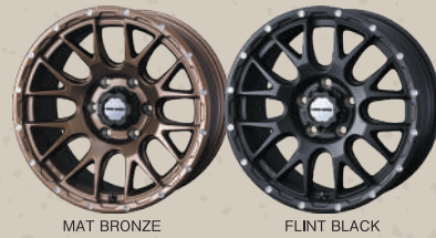
MAT BRONZE FLINT BLACK