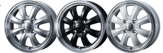
SILVER/RIM POLISH BLACK/RIM POLISH WHITE/RIM POLISH