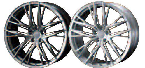
21inch DIAMOND BLACK 21inch BRUSHED