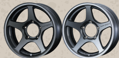
EJ-BRONZE LIGHT GUN-METALLIC