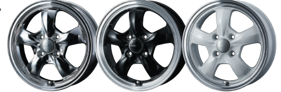
BRIGHT SPATTERING BLACK/RIM POLISH WHITE/RIM POLISH