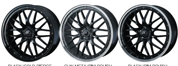
BLACK/GOLD PIERCE GUN-META/RIM POLISH BLACK/RIM POLISH