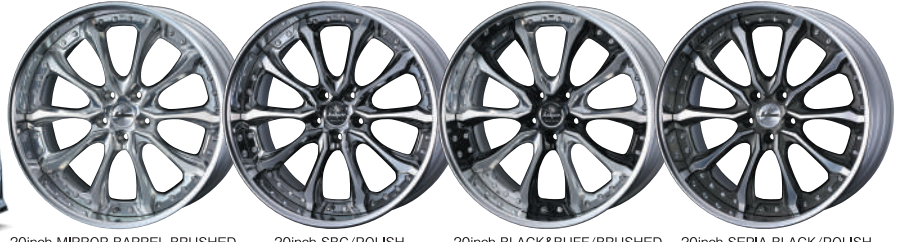
20inch MIRROR BARREL BRUSHED 20inch SBC/POLISH 20inch BLACK&BUFF/BRUSHED 20inch SEPIA BLACK/POLISH