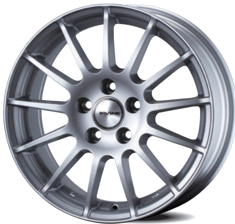
ハイパーシルバー (HS)

■付属品: センターキャップ、エアバルブ ■JWL規格品 ■VIA登録品 ■必ず純正ホイール用のボルト・ナットで装着してください。