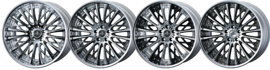
20inch DESIGN CHROME 20inch SBC/POLISH 20inch BLACK&BUFF/BRUSHED 20inch SEPIA BLACK/POLISH