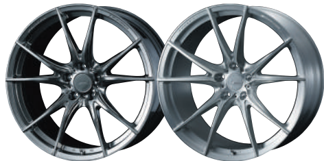
20inch DIAMOND BLACK 21inch BRUSHED