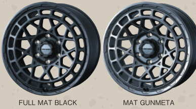
FULL MAT BLACK MAT GUNMETA