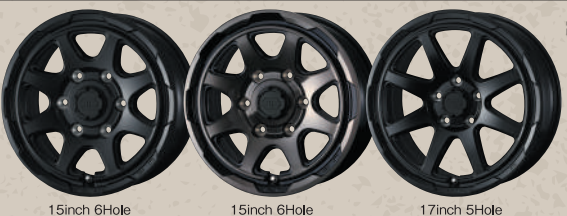
15inch 6Hole SEMI MAT BLACK 15inch 6Hole BLACK POLISH BRONZE-CLEAR 17inch 5Hole SEMI MAT BLACK