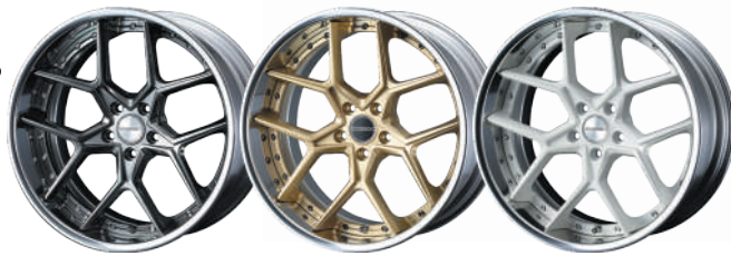
20inch HYPER METAL BLACK 20inch SAMURAI GOLD 20inch WHITE(受注生産)