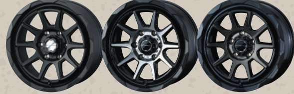
FULL MAT BLACK MAT BLACK POLISH BLACK POLISH BRONZE-CLEAR