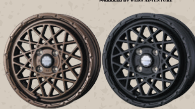
MAT BRONZE FULL MAT BLACK