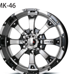
ダイヤモンドグロスブラック(DC/GB)