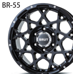
ミルドサティンブラック (MSB)