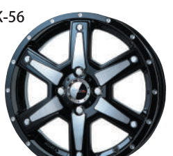
ミルドマシブラック(MMB)