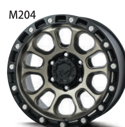
コヨーテブロンズ(CB)

(カラー)ブラックキャット(BC) / ドライグレー(DG) / コヨーテブロンズ(CB) ●補修パーツ価格: センターキャップ 税込価格 ¥4,400 エアリアルブ キャップ&スリーブクローム 税込価格 ¥550 専用レンチ ¥330 専用ビス(1本) 税込価格 ¥330 ●別売エアリアルブ キャップ&スリーブブラック 税込価格 ¥825 ※別売 9.0Jx17 US Spec 6H用センターキャップLow Type 税込価格 ¥4,400 ■JWL、JWL-T規格適合品(但し、5HはJWL規格のみ、9.0Jx17はSAE J2530規格のみとなります) ※別途専用ナットが必要です。