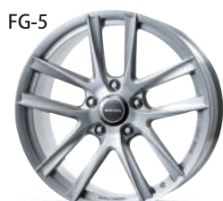
ブラッシュド w/パウダーコーティング (BWP)