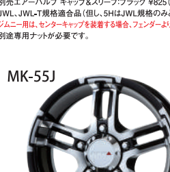
ダイヤモンドグロスブラック(DC/GB) / ジムニー用