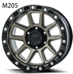
コヨーテブロンズ(CB)