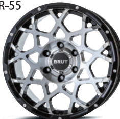
ミルドマシンブラック (MMB)