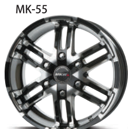
ダイヤモンドグロスブラック(DC/GB) / ダイヤモンドパールホワイト(DC/PW)