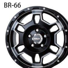
ミリタリーブラック (MLB)