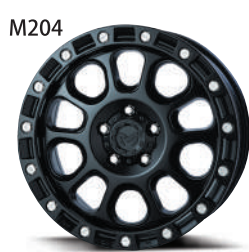
ブラックキャット(BC)