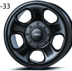
17" ミリタリーブラック (MLB)