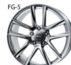
ミラーフィニッシュ w/パウダーコーティング (MWP)