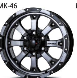
ダイヤモンドグラファイトクリア(DC/GC)