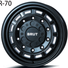
ミリタリーブラック (MLB)