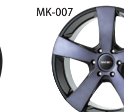
グラファイトクリア(GC)