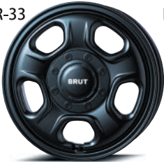
14" ミリタリーブラック (MLB)