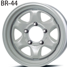
ミルクィホワイト (MLW)