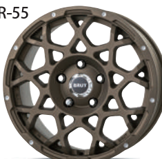
デザートブロンズ (DB)