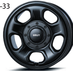
16" ミリタリーブラック (MLB)