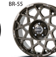
シャンパンゴールド (CPG)