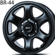
ミリタリーブラック (MLB)