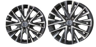
SMACK LEGINA 13 14 15 16 17 18 スポーク スマック レジーナ