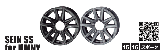
SEIN SS for JIMNY 15 16 スポーク

ザイン エスエス フォーハイエース & エヌブイ350 キャラバン 15x6.0J (税込)¥16,500 - ¥17,600