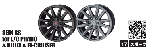
SEIN SS for L/C PRADO & HILUX & FI-CRUISER 17 スポーク

ザイン エスエス フォージムニー 15x5.5J - 16x5.5J (税込)¥15,950 - ¥19,250