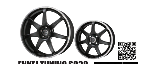
ENKEI TUNING SC38 15 16 17 18 スポーク

エンケイチューニング エフシーゼロワン 17x7.0J - 20x9.5J (税込)¥37,400 - ¥62,700