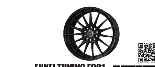
ENKEI TUNING FC01 17 18 19 20 フィン

エンケイチューニング エフシーゼロワン 17x7.0J - 20x9.5J (税込)¥37,400 - ¥62,700