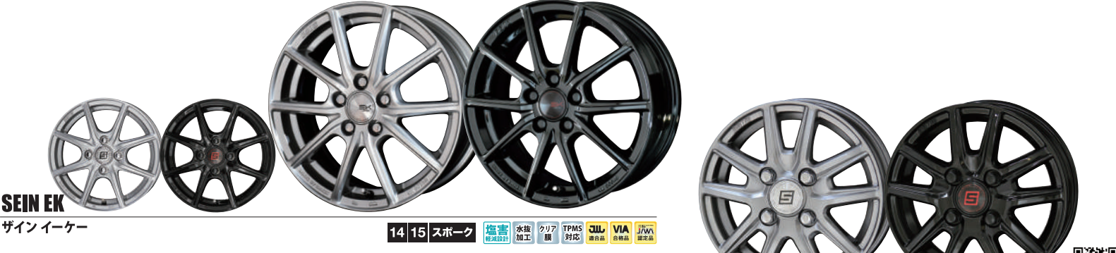
SEIN EK ザイン イーケー 14 15 スポーク