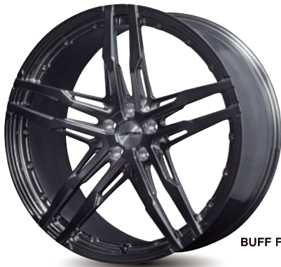
BUFF FINISH × GRAY CLEAR