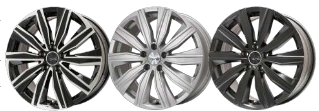
ブラックポリッシュ シルバー マットブラック

●設定色: シルバー、マットブラック、ブラックポリッシュ ●ボルト穴径: φ15, MB用φ29 ●TPMS対応: ランプラットタイプ対応 ●純正H&A対応 ●ターゲメント-HEX CAPHS ●バルブ/バルブキャップ ■Standard Color: Silver, Matte Black, Black Polish ■Included: Center Cap, Air Valve