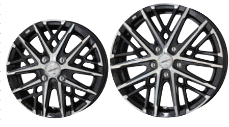
SMACK GLAIVE 13 14 15 16 17 18 スポーク スマック グレイブ