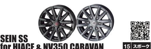
SEIN SS for HIACE & NV350 CARAVAN 15 スポーク

ザイン エスエス フォーハイエース & エヌブイ350 キャラバン 15x6.0J (税込)¥16,500 - ¥17,600