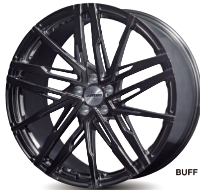
BUFF FINISH × GRAY CLEAR