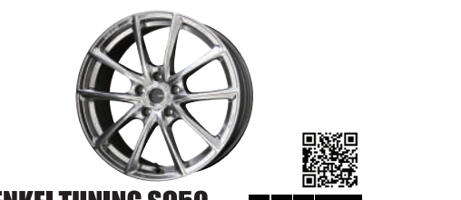
ENKEI TUNING SC50 18 19 20 スポーク

エンケイチューニング エスシースリーエイト 15x4.5J - 18x8.5J (税込)¥29,150 - ¥45,100