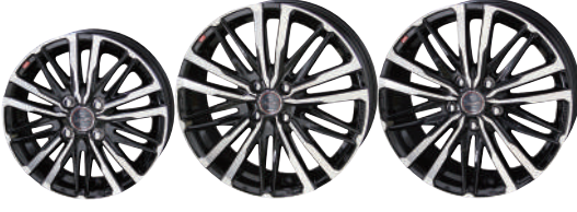
SMACK CREST 13 14 15 16 17 18 スポーク スマック クレスト