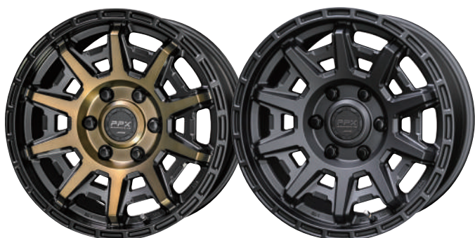
BLACK × POLISHED × MATTE BRONZE CLEAR