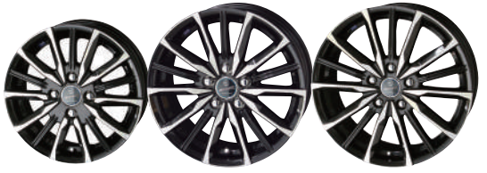
SMACK WALKIRIE 13 14 15 16 17 18 スポーク スマック ヴァルキリー