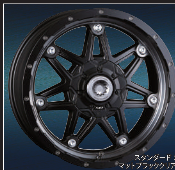
スタンダード : マットブラッククリア