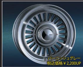
パーニッシュグレイ 税込価格 ¥2,200UP