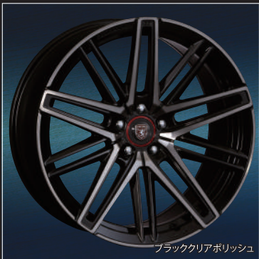
ブラッククリアポリッシュ