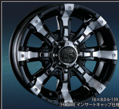
16×8.0 6-139.7 (Hi-MiPE インサートキャップ仕様)

●COLOR : マットブラック(上記価格) ブラック×マシニングリップ 税込価格 ¥2,200UP ※印のサイズは、JWL-T & JWL 規格対応サイズ。その他は JWL 規格対応です。