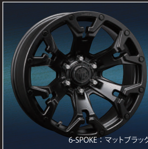
6-SPOKE : マットブラック