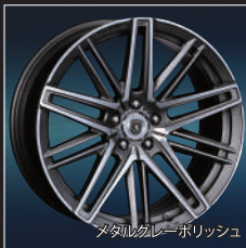
メタルグレーポリッシュ