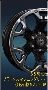
6-SPOKE : ブラック×マシニングリップ 税込価格 ¥2,200UP