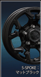
5-SPOKE : マットブラック