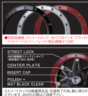
●別売品価格 : ストリートロック 16/17/18インチ(ブラック/ハイパーシルバー/レッド) 税込価格 ¥5,500