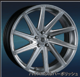
ハイハイシルバーポリッシュ