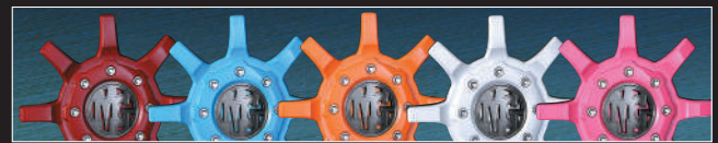
カラーインサートキャップ 税込価格 ¥2,200 / オナメントエンブレム(ブラッククローム) 別売

●COLOR : ブラックポリッシュ ●付属品価格 : インサートキャップ(クローム) 税込価格 ¥2,200 / インサートオープナー 税込価格 ¥220 オナメントエンブレム(ブラック) 税込価格 ¥1,100 / コムバリエーション ¥660 ●オプションパーツ : カラーインサートキャップ 税込価格 ¥2,200 オナメントエンブレム(ブラッククローム) 税込価格 ¥1,100 ■※1 は JWL&JWL-T 規格適合品 ※2 は JWL 規格適合品