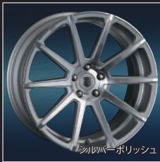
シルバーポリッシュ