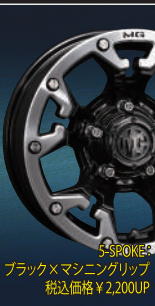
5-SPOKE : ブラック×マシニングリップ 税込価格 ¥2,200UP