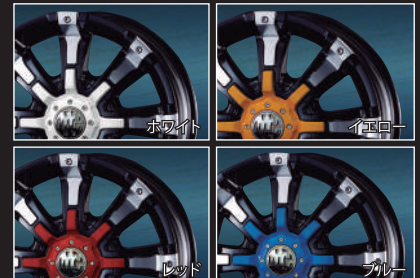
※HI-TYPE インサートキャップ仕様は設定無し カラーインサートキャップ 税込価格 ¥2,750 オナメントエンブレム(ブラッククローム) 税込価格 ¥1,650

●COLOR : ブラックポリッシュ ●付属品価格 : HI-TYPE インサートキャップ(クローム) 税込価格 ¥3,300 / LOW-TYPE インサートキャップ(クローム) 税込価格 ¥2,750 センタープレート(ブラック) 税込価格 ¥2,200 / オナメントエンブレム(ブラック) 税込価格 ¥1,650 / リムバリエーション ¥660 ハブキャップ (MYRTLE ロゴ入り) 税込価格 ¥660 / 取付ビスセット (3 倍セット) 税込価格 ¥980 / トルクスレンチ 税込価格 ¥880 ●オプションパーツ : カラーインサートキャップ (LO タイプのみ) 税込価格 ¥2,750 オナメントエンブレム(ブラッククローム) 税込価格 ¥1,650 ※印のサイズは、JWL-T & JWL 規格対応サイズ。その他は JWL 規格対応です。