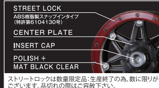
STREET LOCK ABS樹脂製スチーフインタイプ (特許第6104130号) CENTER PLATE INSERT CAP POLISH + MAT BLACK CLEAR