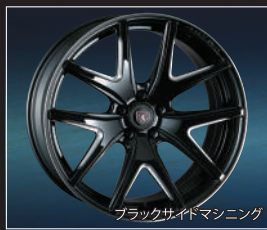
ブラックサイドマシニング