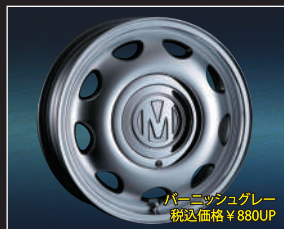
パーニッシュグレイ 税込価格 ¥880UP