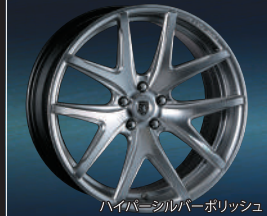
ハイハイシルバーポリッシュ