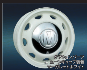
オプションパーツ ムーンキャップ装着 マーガレットホワイト