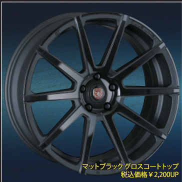
マットブラックグロスコートトップ 税込価格 ¥2,200UP