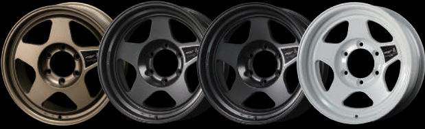
MTB (マットチャンブロンズ) MDG (マットディーブグレー) MSB (マットシャドーブラック) 白無垢 (ビュアホワイト)