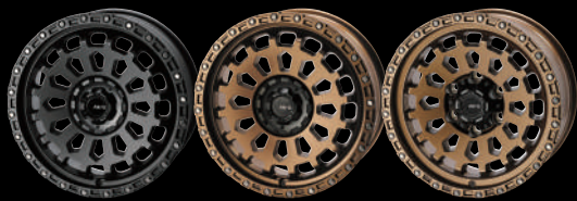
Matte Gunmetallic (10H Model) Matte Bronze (10H Model) Matte Bronze (6H Model)