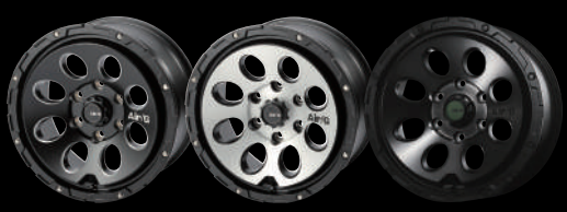
Matte Black Matte Black Brushed GHOST EDITION