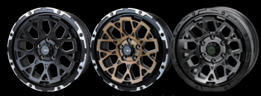
Matte Black Rim Diamond Cut Stealth Bronze Brushed Rim Diamond Cut GHOST EDITION