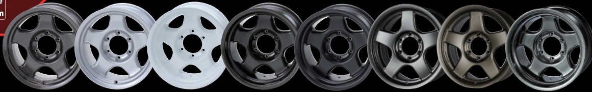
(GM(ガンメタリック) BS(ブライトシルバー) PW(パールホワイト) SB(スーパーブラック) MB(マットブラック) MGM(マットガンメタリック) MBR(マットブロンズ) HBII(ハイパーブラックII))