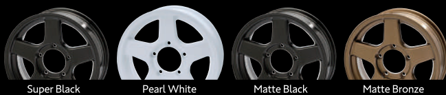
Super Black Pearl White Matte Black Matte Bronze