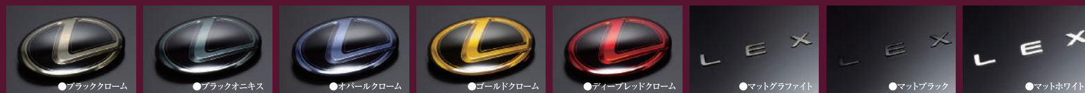
ソリッドカラーエンブレム Ver.LEXUS 価格適合リスト 2023.11現在

これまでリアルタイムに車両を所有するオーナー様だけに提供されていたレクサス純正のエンブレムが遂に解禁。弊社でもトヨタ各モデル同様にレクサスオーナーの皆様へご提案をさせて頂ける展開となりました。前後に採用のリンボル、ガラスレス意匠は5つのバリエーションを。車名ロゴなどをはじめとする従来意匠のエンブレムは8つのバリエーションを用意、いわゆる旧来から認知される「自動車のカスタマイズ」とは少し趣向の違う路線、「純正理念」をどうぞお楽しみください。